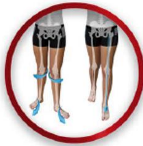
Stellungsveränderung der Zehen führt zu Hüft- und Sprunggelenksstabilität

Biomechanische Veränderungen auf die Füße und Knie können mit Xelero Schuhen und Schuheinlagen nach Mass erreicht werden. So können Schmerzen bei den meisten Patienten spürbar reduziert werden. Der Aufbau der Schuhe ist geeignet um in Zusammenarbeit mit Spezialisten weitere pathologische Bedingungen, wie Fussfehlstellungen, Fussbeschwerden, Knie- oder Hüftproblemen zu behandeln. Der Effekt dieses Schuhs zeigt sich vor allem bei langem Stehen und Gehen und ist sofort spürbar.